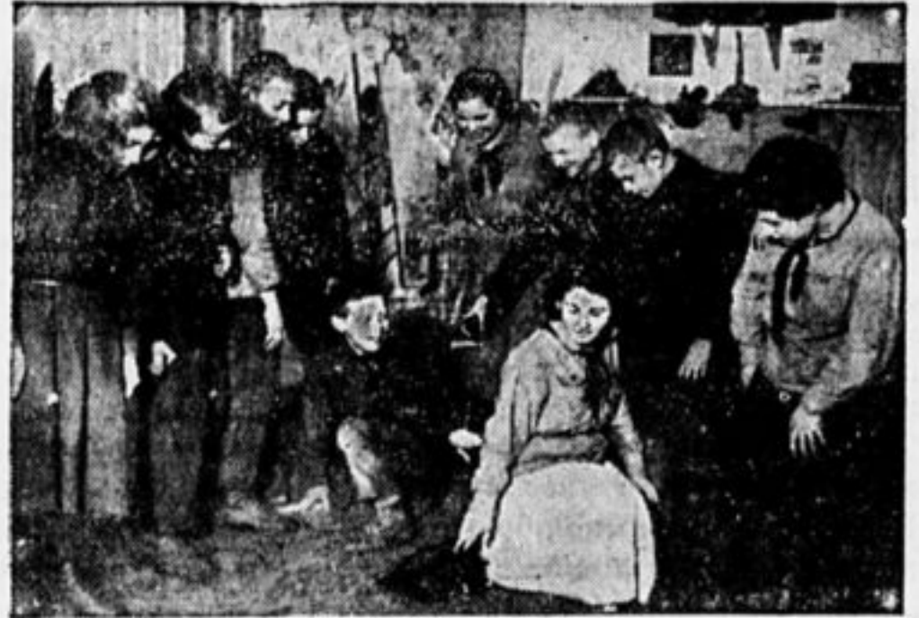
В БОЛЬШУЮ ПЕРЕМЕНУ.

Из третьих гр. — 129 чел. Из четвертых гр. — 185 чел. Мы еще не умеем быть хозяевами в школе. У нас 97 процентов ребят — дети рабочих. Мы скажем настоящие хозяева школы. А ребята это плохо сознают. Небо-