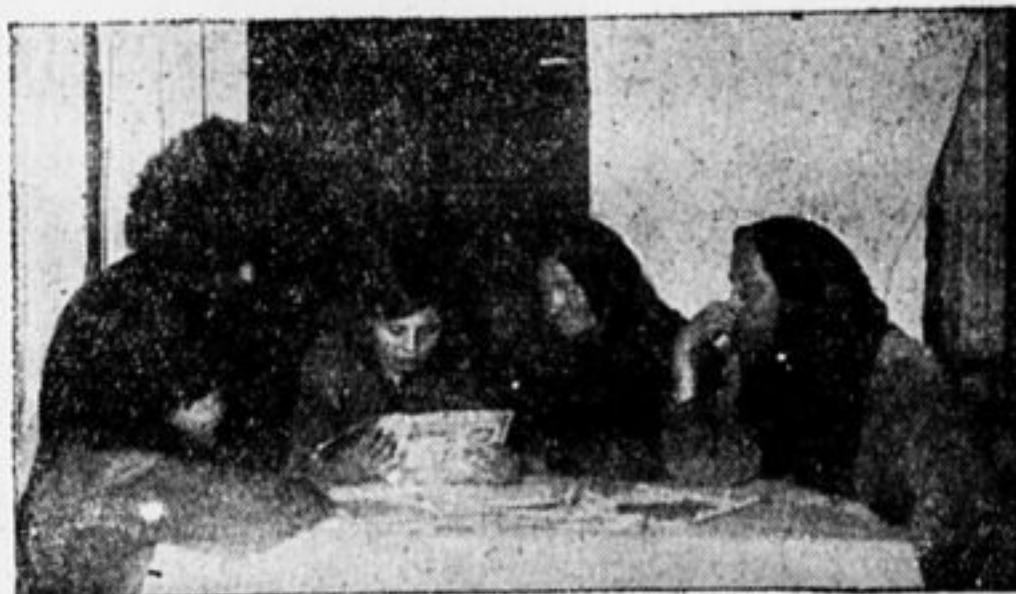
ПИОНЕРКА В ИЗБЕ-ЧИТАЛЬНЕ.

на все интересующие их вопросы. Эта работа нам очень нравится. Мы думали ее не бросать и после того как всех ребят выучим грамоте. Мы хотим организовать ячейку «Общества Долой Неграмотность» и