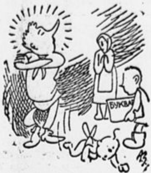
Петя нос задрал высоко Ореолом окружен На собрания... далеко Уезжает тотчас он!