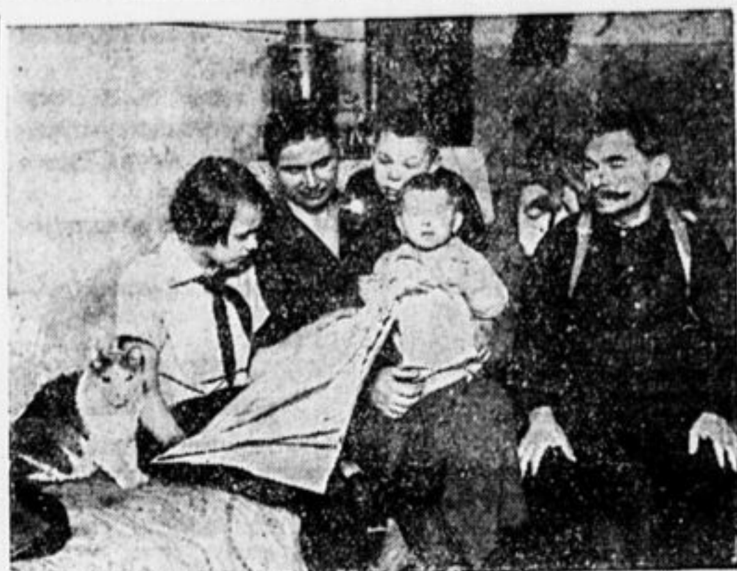
ВСЕЙ СЕМЬЕЙ—ЗА РАБОТУ.