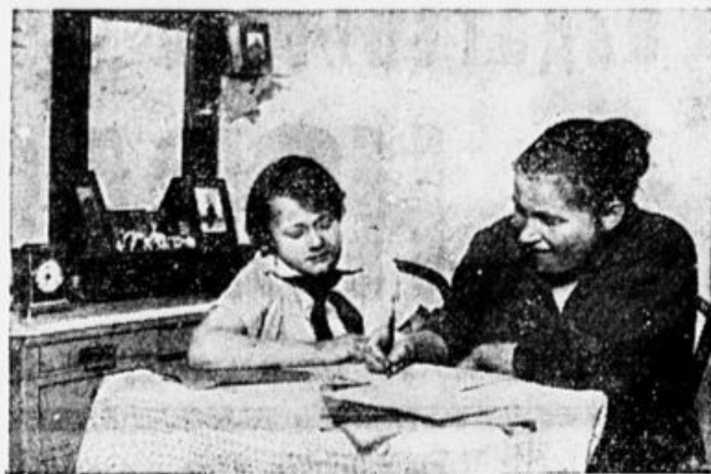
ПОМОГАЕМ ДРУГ ДРУГУ.

У каждого свое. Семья наша небольшая: я и мать. Вот и всего. Мать целый день на фабрике, а мне приходится и комнату подмести и в лавку сходить. Я мать жалею и не хочу, чтобы она после восьмичасового рабочего дня на фабрике трудилась еще дома.