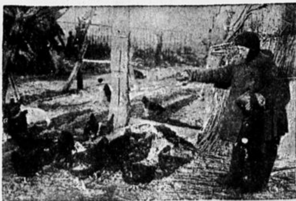
КОРМИТ ДОМАШНЮЮ ПТИЦУ.