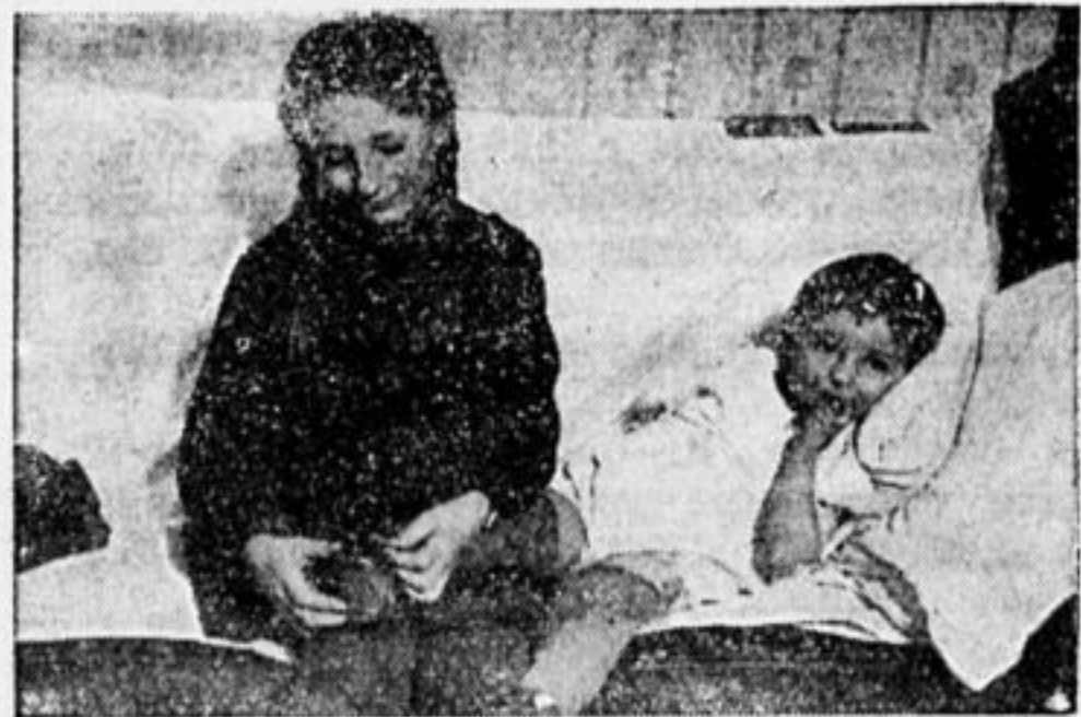
ЗАБОТЬСЯ О МЛАДШИХ БРАТЬЯХ И СЕСТРАХ.