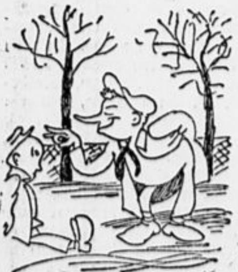
На дороге «беспартийный»... Обработать... будет толк!!! Миг... и палец Петькин длинный В лоб несчастного щелк, щелк.